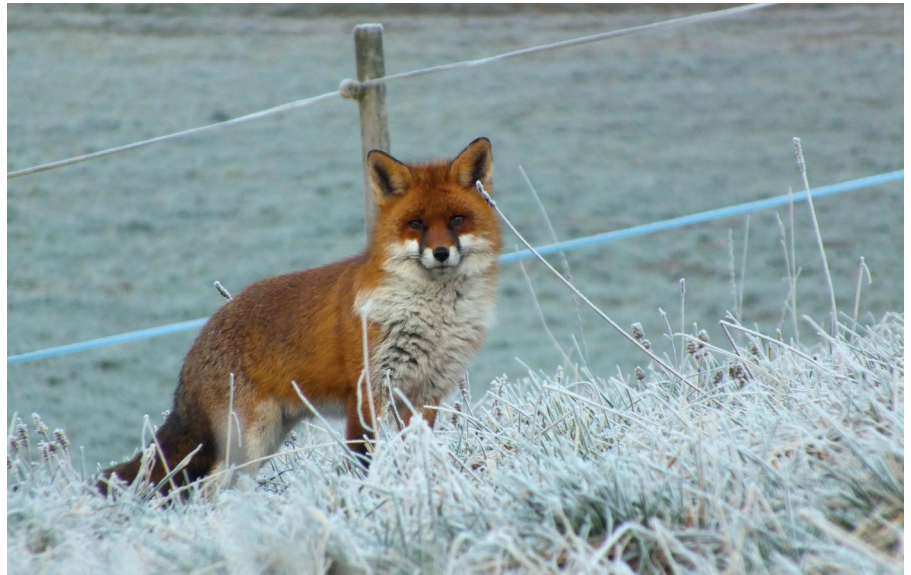
Fuchs mit Winterfell beim Lupsinger Ischlag

In den letzten zwei Monaten kam es im Gebiet der Hauptstrasse zu mehreren Brandfällen, bei welchen Brandstiftung nicht ausgeschlossen werden kann. Die Polizei Basel-Landschaft hat die entsprechenden Ermittlungen aufgenommen und sucht Personen die etwas bemerkt haben. Der Gemeinderat bittet alle Einwohner:innen die Polizei zu unterstützen und sich bei der Einsatzleitzentrale der Polizei Basel-Landschaft in Liestal,