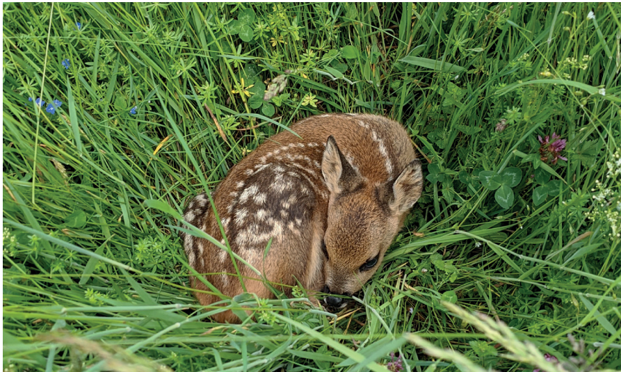
Rehkitz im Hallgart.

Im Ziefner Bann setzen die Rehgeissen jedes Frühjahr rund 60 Kitze. Mehr dazu was Bauern und Jäger unternehmen um sie zu schützen in diesem Mitteilungsblatt.