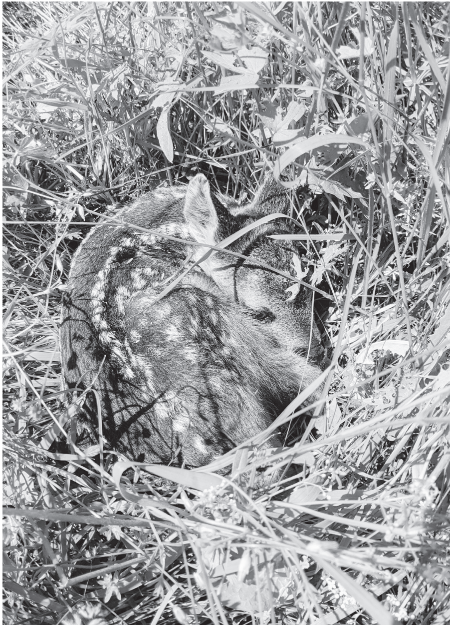
Rehkitz im Juch