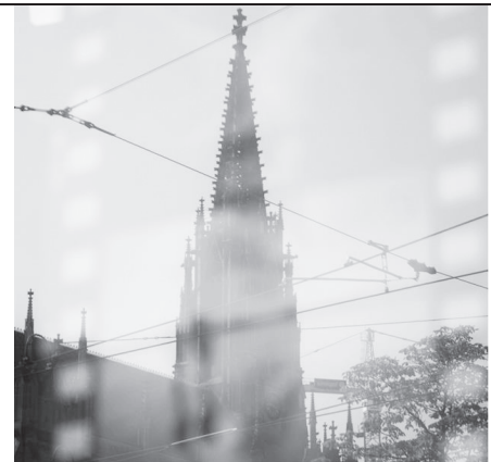
KIRCHGEMEINDEKINO: BESONDERE FILME IN BESONDERER ATMOSPHERE

Kirchgemeindekino, jeweils freitags: Ziefen, 11.11.22, 19 Uhr / Lupsingen, 20.1.23, 20 Uhr / Ziefen, 3.2.23, 20 Uhr und Arboldswil, 24.3.23, 20 Uhr.