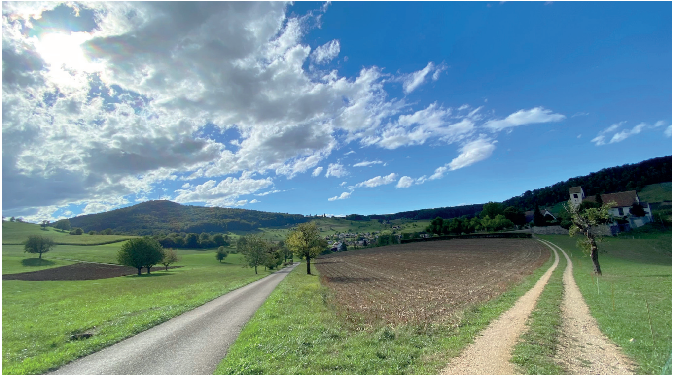
Welchen Weg würdest du wählen?