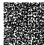
C Merkblatt Nutzung von Aussenräumen im Siedlungsgebiet