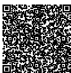
B Merkblatt Landwirtschaftliche Nutzung im Gewässerraum