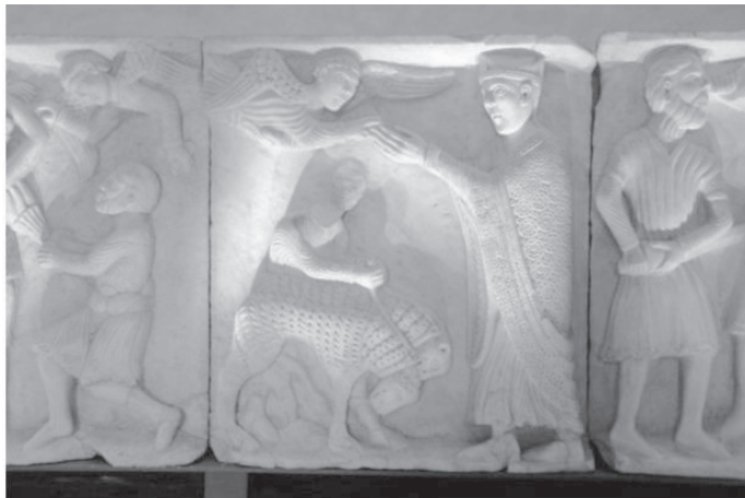
Martyrium des Hl. Blasius, Spoleto, 11. Jahrhundert