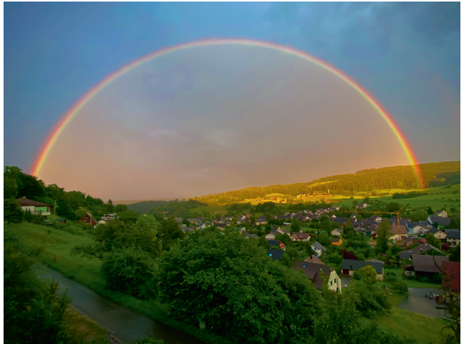
Der Sommer 2024 bot viele Chancen für Regenbögen. Eine besonders schöne Stimmung von der Chäppele aus fotografiert am 15. Juli um 21 Uhr von David Thommen.