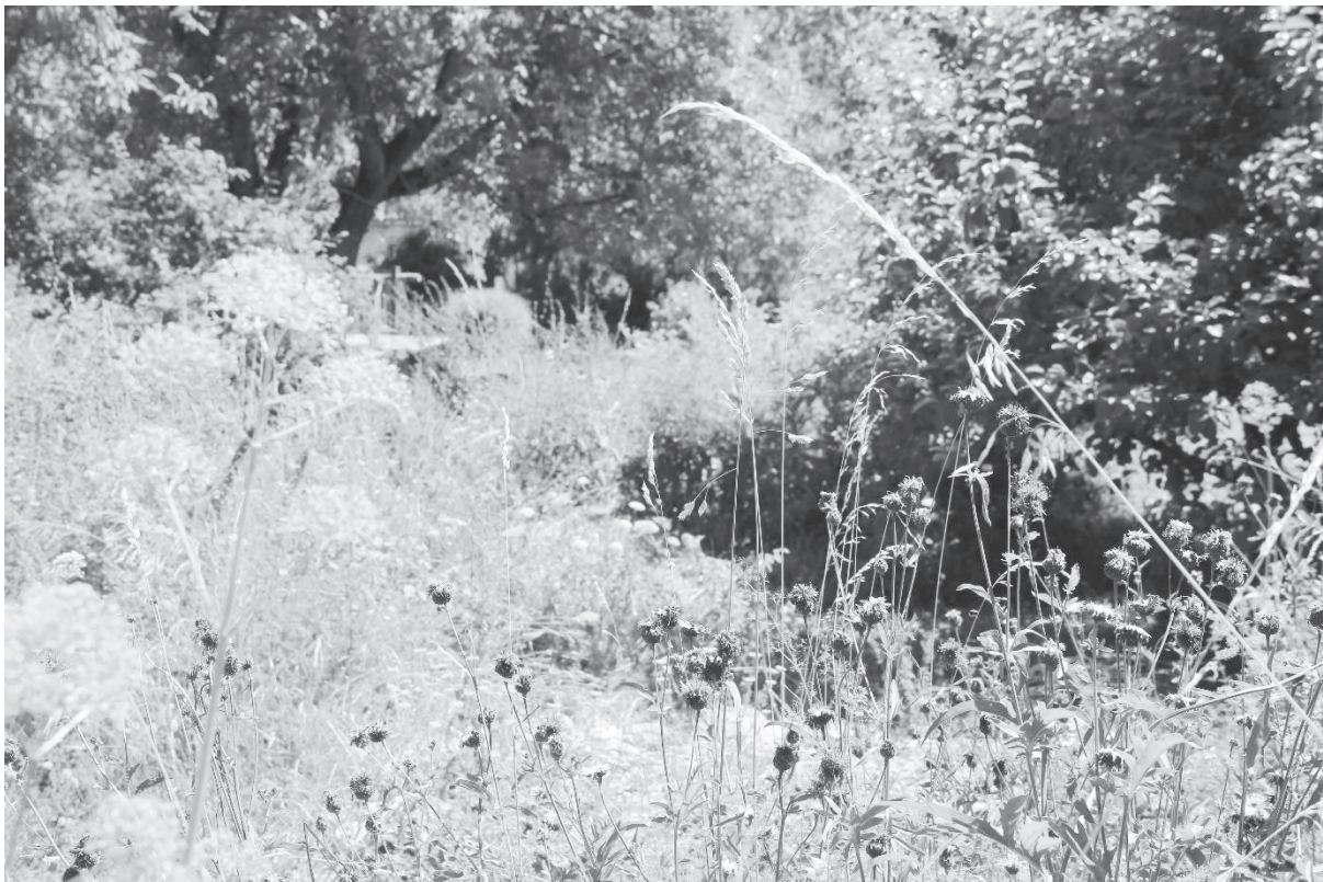
Bild: Naturnaher Garten, Schulhausareal Ziefen.

Unsere Gärten bieten viel Potenzial für die Förderung der einheimischen Artenvielfalt. Koni Gschwind zeigt in seinem Vortrag mit Bildern und Beispielen , wie Sie ein Paradies für Insekten, Vögel und andere Tiere in Ihrem Garten schaffen können. Nach dem Vortrag haben Sie die Möglichkeit, einheimische Sträucher für Ihren Garten zu einem Vorzugspreis zu bestellen.