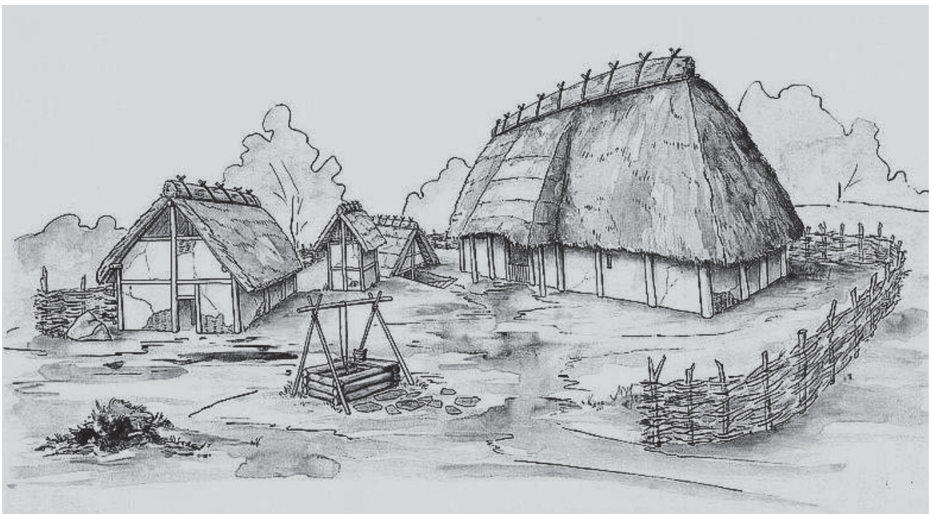
Gehöft der Merowingerzeit

Auf diesem Abendspaziergang mit Rémy Suter erfahren wir, wie das Dorf einst verwaltet wurde. Die verschiedenen Dorfteile hatten verschiedene Herren und die jeweiligen Bewohner waren deren Untertanen. Ein Streifzug durch über 800 Jahre Geschichte.