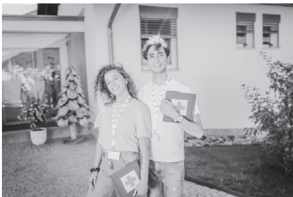
Studenten werben für das Rote Kreuz Baselland

Mit der Haustüraktion möchte das Rote Kreuz Baselland seine regionalen Hilfsangebote nachhaltig sichern. Es dankt allen herzlich, die mit ihrer Mitgliedschaft einen wichtigen Beitrag für Menschen in der Region leisten.