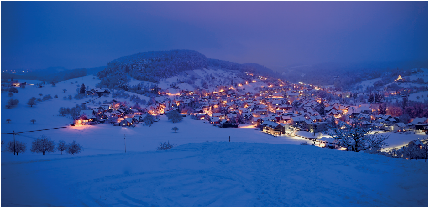
Abenddämmerung in Ziefen, Foto von Patrick Tanner