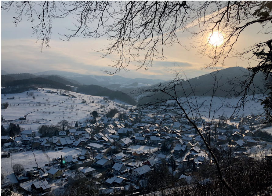
Ziefen im Schnee, Winteraufnahme vom 11. Februar 2021