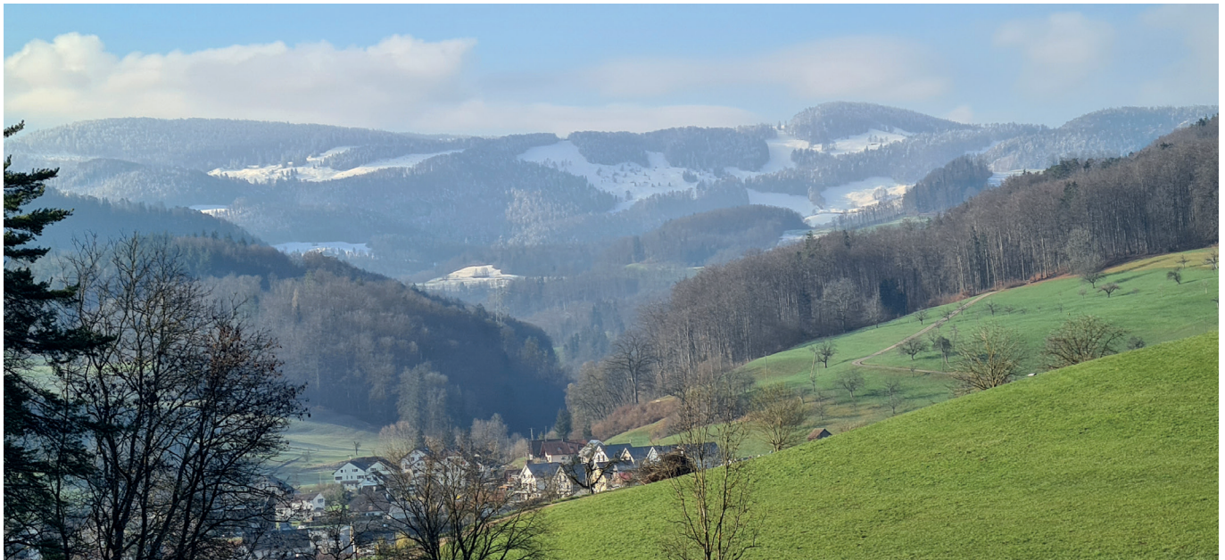
Der Winter zieht sich langsam auf die Jurahöhen zurück – aufgenommen durch Eddi Brander am 19. März 2021.