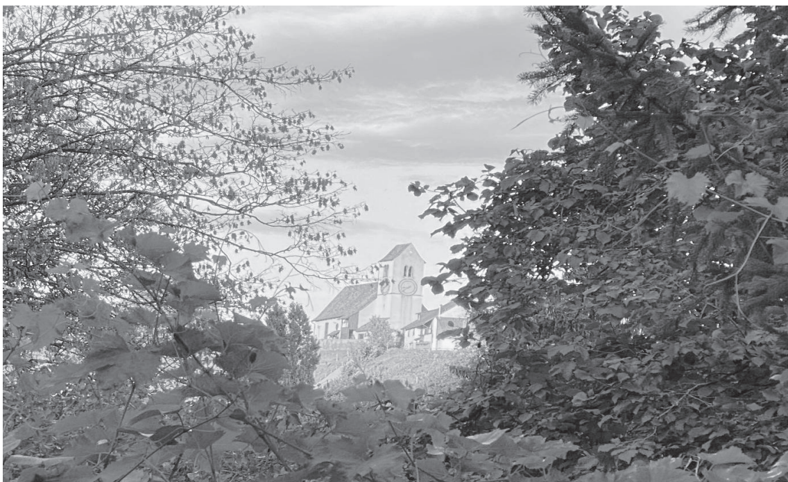
Unsere St. Blasius Kirche auf dem Kilchberg seit mehr als 1000 Jahren

Am Sonntag 15. März 2020 sind auch die Türen in unserer Kirche wegen des Virus C19 geschlossen worden. Keine Gottesdienste mehr : keine Konfirmation, kein Ostergottesdienst. Eine bedrückende und beängstigende Situation, die uns alle getroffen hat und gefordert hat. Auch das kirchliche Leben wurde wie in vielen anderen Bereichen in die digitale Welt verlagert.