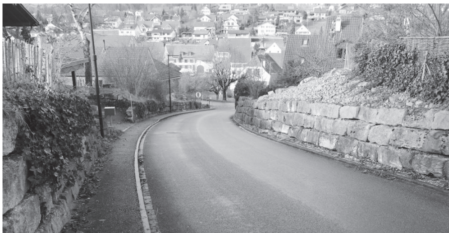
Die Ziefnerstrasse in Lupsingen wird instand gestellt.

Die Bauarbeiten umfassen die Instandstellung der Ziefnerstrasse im Abschnitt Seltisbergerstrasse bis Quellenweg, den Ersatz der Hauptwasserleitung und den Werkleitungsbau. Der Deckbelag wird im Frühling 2021 eingebaut. Die Zufahrt