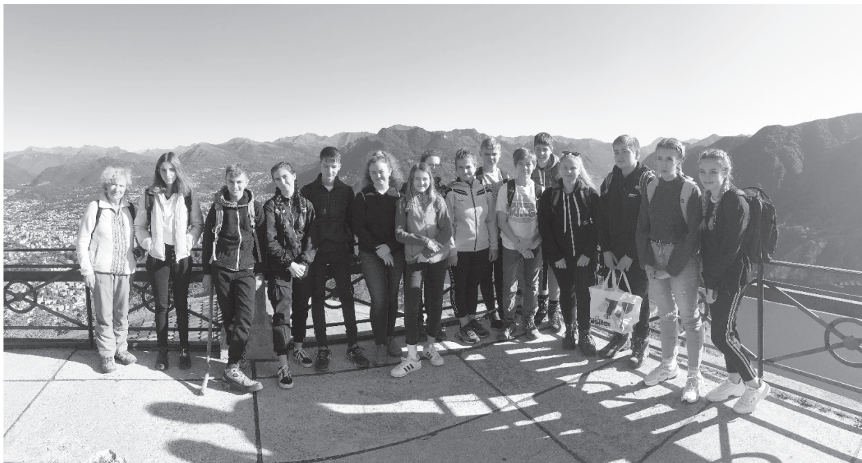
Die Konfirmandenschar aus Ziefen - Lupsingen - Arboldswil hoch über dem Lago di Lugano auf dem Piz San Salvatore 3. Okt. 2020