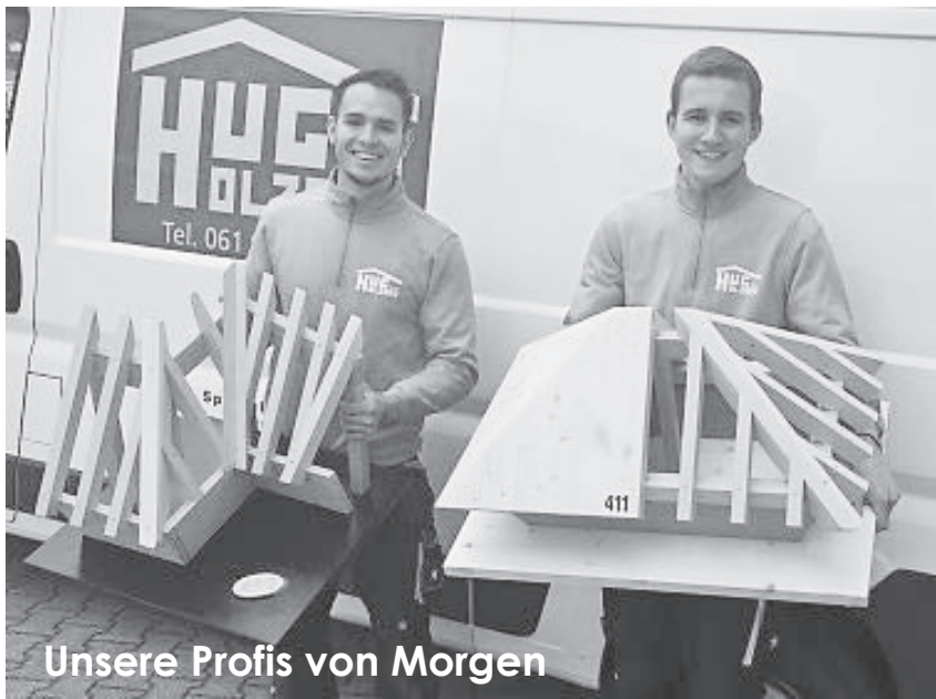
Unsere Profis von Morgen