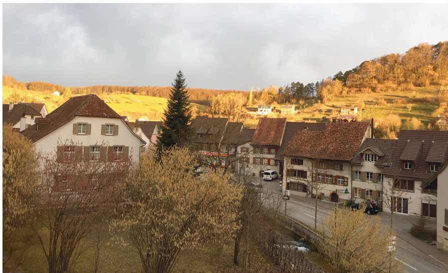
Sonnenaufgangsstimmung am 4. März 2019.

Wir danken Ihnen für die Mitarbeit für einen attraktiven öffentlichen Verkehr in unserer Region.