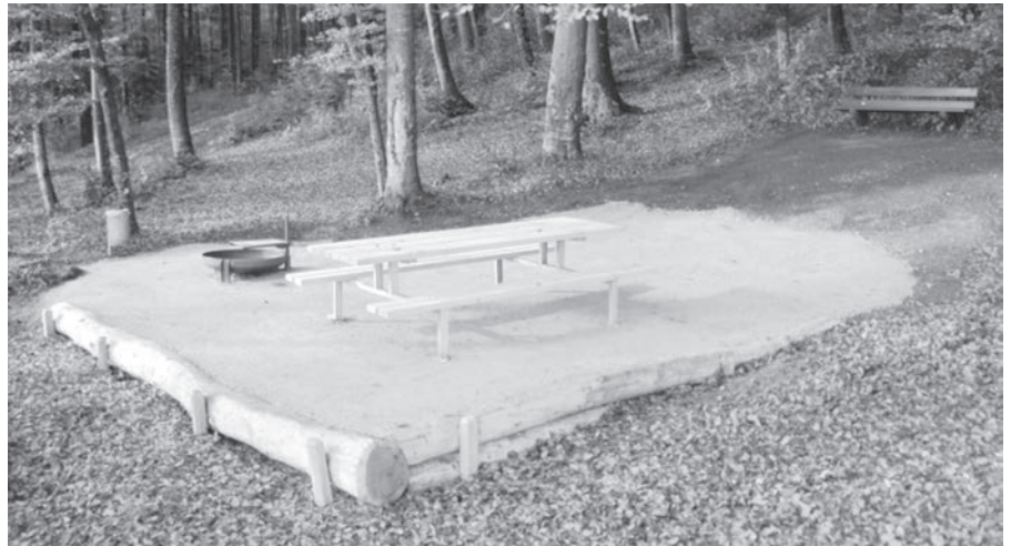
Der Rastplatz Hallgart erstrahlt dank des Einsatzes des Werkhofs in neuem Glanz und lädt dazu ein genutzt zu werden, sobald es das Wetter zulässt.

Inhaltlich hat sich grundsätzlich (noch) nicht viel geändert. Wir werden aber verschiedene Vorschläge aus der Umfrage auf dem Radar behalten: