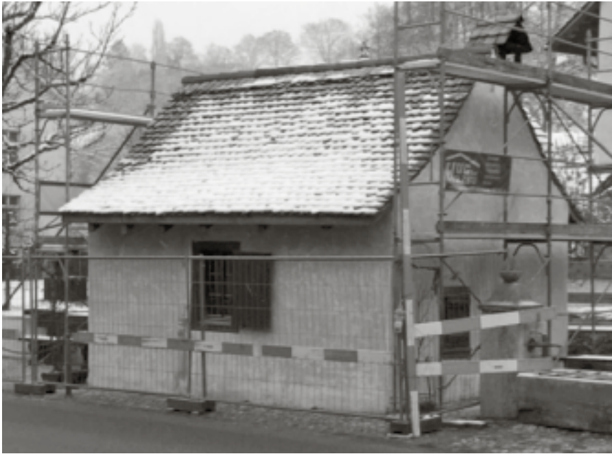
Der Kälteeinbruch von Ende März verzögert die Reparatur- und Renovationsarbeiten am Bachhüsli, welche nach der Beschädigung durch den Bus notwendig geworden sind.

Offizielles Publikationsorgan der Gemeindebehörde Ziefen