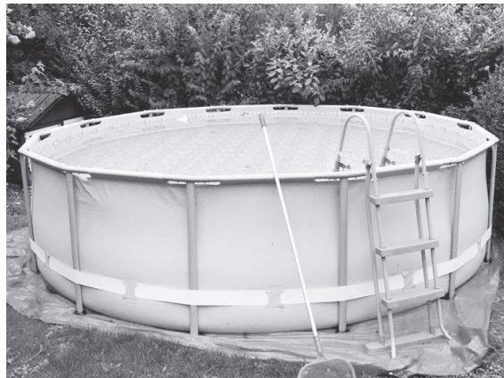
Mobil aufstellbarer Pool im Garten