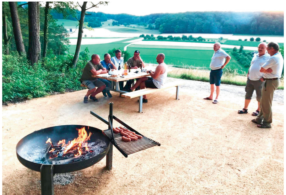
Feuerstelle im vorderen Bloond renoviert (siehe Information auf Seite 7). Die Banntagsschützen Ziefen und der Bürgerrat geniessen die herrliche Aussicht und nutzen die Vorteile der neuen Grillstelle ein erstes Mal.

Beim Ressourcenausgleich leisten Einwohnergemeinden, deren Steuerkraft über dem Ausgleichsniveau liegt (Gebergemeinden), Beiträge an Einwohnergemeinden, deren Steuerkraft unter dem Ausgleichsniveau liegt (Empfängergemeinden). Die Steuerkraft einer Einwohnergemeinde ist der Steuerertrag natürlicher und juristischer Personen bei durchschnittlichem (fiktivem) Steuerfuss und -satz pro Einwohner. Die Höhe des Beitrags pro Einwohner einer Empfängergemeinde entspricht der Differenz ihrer Steuerkraft zum Ausgleichsniveau. Vorbehalten bleibt eine allfällige Kürzung dieses Betrags falls die hypothetische Abschöpfung bei den Gebergemeinden über 17% ihrer Steuerkraft