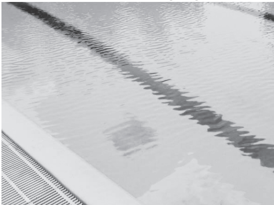
Fest installiertes Schwimmbecken

Das vorliegende Merkblatt richtet sich an Inhaber von privaten Schwimmbecken und von mobil aufstellbaren Pools. Gezeigt sind die Grundsätze zum umweltgerechten Umgang mit Becken-, Pool- und Reinigungswasser.