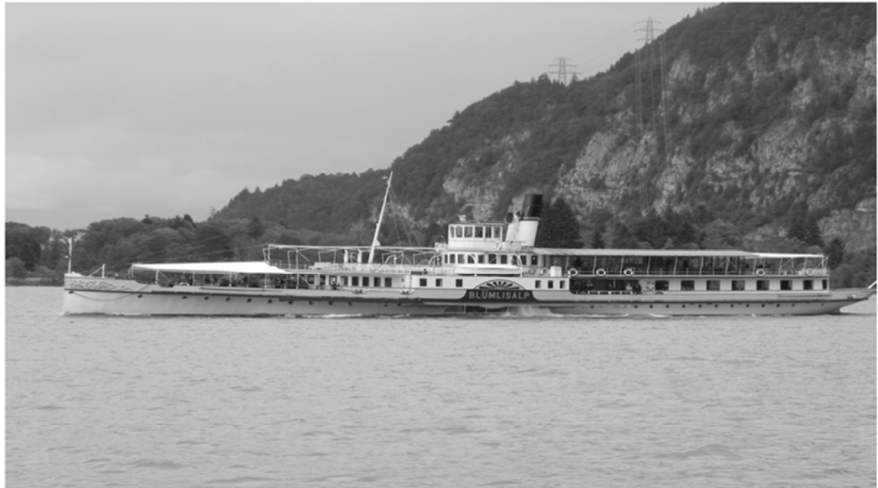
Die legendäre „Blüemlisalp“ – Raddampfer aus dem Jahre 1906 - auf dem Thunersee im Einsatz

Mit freundlichen Grüßen aus dem Ziefner Pfarrhaus - Hans Bollinger