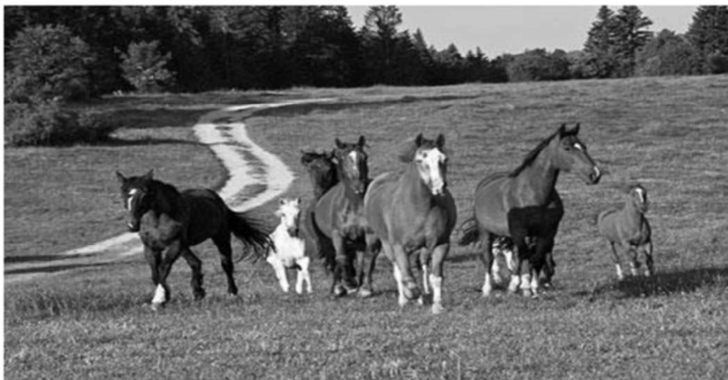
Pferdeweiden in den Freibergen – die älteren Pferde können hier ihren Lebensabend geniessen

Dieses Jahr führt uns die Seniorenreise in die Freiberge nach Le Roselet