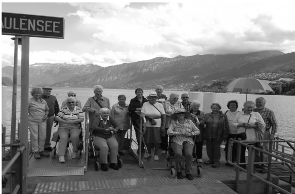
Eine Erinnerung, sogar mit Sonnenschirm, auf dem Schiffssteg in Faulensee

Eine abwechslungsreiche, interessante und fröhliche gemeinsame Ferienwoche gehört ins Erinnerungsalbum. Eine 20-köpfige Reisegruppe ist am Montagmorgen, dem 13. Juni 2016 mit zwei Büssli ins Berner Oberland gefahren mit dem schönen Ferienziel Hotel Seegarten Marina in der Spiezer Bucht, direkt am Wasser. Obwohl auch sehr viel Wasser vom Himmel gefallen ist in diesen Tagen, haben wir verschiedene Ausflüge : mit dem Schiff nach Interlaken, mit dem Büssli auf die Grimmialp im Diemtigtal und per pedes nach Faulensee, glücklicherweise jeweils mit Sonnenschein ☺!