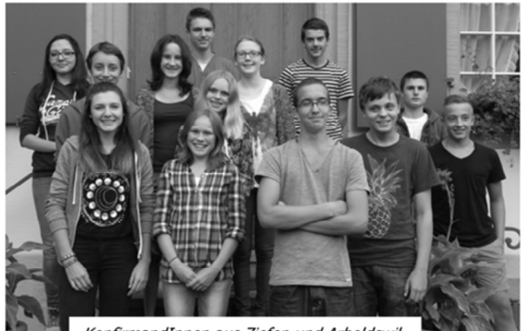
KonfirmandInnen aus Ziefen und Arboldswil

Ein allseits frohes und beschwingtes Fest mit Familie und Freunden und für die berufliche wie auch die private Zukunft wünschen wir allen junger