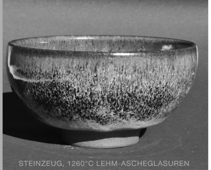
STEINZEUG, 1260°C LEHM-ASCHEGLASUREN