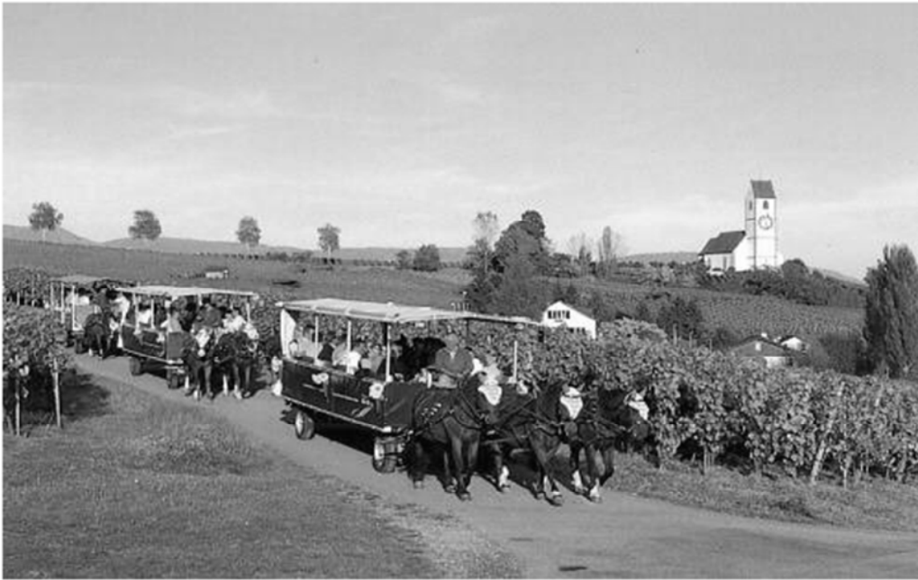
Mit dem Pferdewagen durch die Hallauer Rebberge

Dieses Jahr führt uns die traditionelle Seniorenreise in die äusserste Ostschweiz – ins Klettgau.