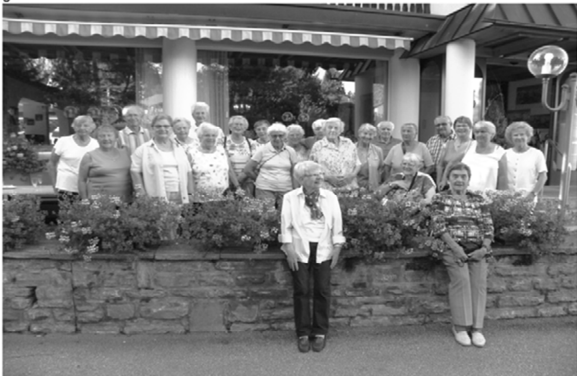
Die Seniorenfamilie kurz nach der Ankunft im Hotel Cresta in Flims – Waldhaus, GR

Die Seniorenferienwoche im schönen Flims, GR, haben wir genossen! Liebevoll empfangen im Hotel Cresta, mit feiner Küche verwöhnt, charmant serviert und kunstvoll geschmückt, sind die Mahlzeiten zum Fest geworden. Im felsigen Vorderrheintal haben wir in den morgendlichen Andachten über die biblischen Berge nachgedacht, gemeinsam Lieder angestimmt und unter kundiger Leitung die tägliche Gymnastik in der Form Tanzen im Sitzen mit viel Humor und allmählicher Kondition im Tagesprogramm eingebaut.