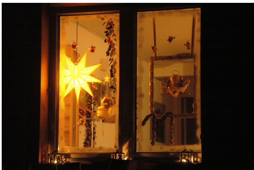
Ziefner Adventsfenster

Offizielles Publikationsorgan der Gemeindebehörde Ziefen