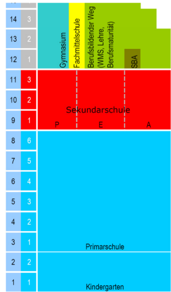
Mit der Bildungsharmonisierung kommen die Bildungssysteme beider Basel in Einklang.