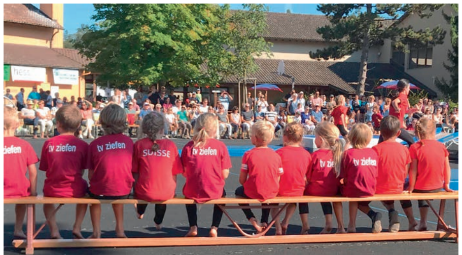
Ebenfalls fand auf der Schulanlage Eien der Vereinsturntag des TV Ziefen mit einem 90 min. Turnspektakel statt.