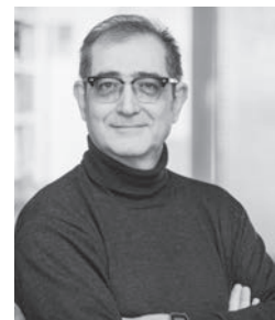
Samir, Regisseur von «Bagdad In My Shadow»

Beim anschliessenden Filmgespräch mit Samir besteht die Möglichkeit, mit dem Regisseur des Films ins Gespräch zu kommen und den Film zu vertiefen.