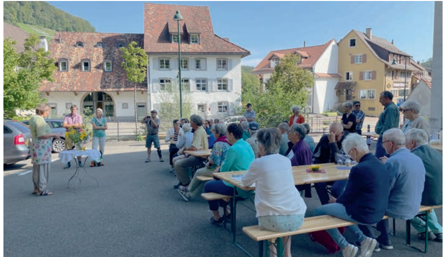
Bei herrlichem Herbstwetter wurde am 18. September das Ziefner Infohüsli Alti School eröffnet.

Die Korksammlung welche sich auf der Gebäuderückseite der Cheesi befindet wird per 1. Oktober zum Werkhof ver-